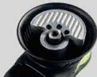
Bölünmüş eksantrik blok