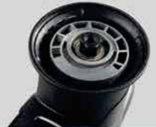
Rüzgar kılavuzlu tek parça eksantrik blok