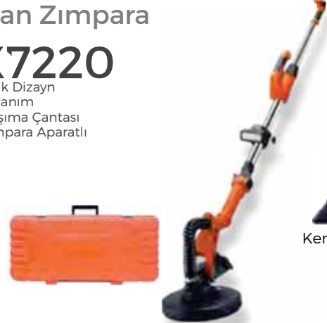
Kenar Zımpara Aparatı