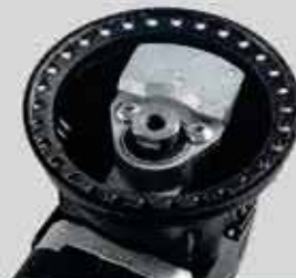
Tek parça eksantrik blok